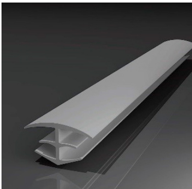
Tapa perfil junta dilatación